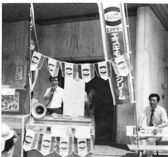
1982. セタ祭の3日間アクト資金の為飲料水の販売