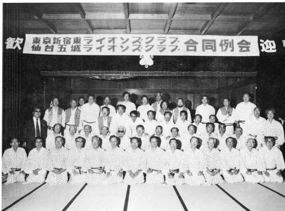
1982. 毎年姉妹友好クラブ 東京新宿東 LC と合同例会実施(於秋保)