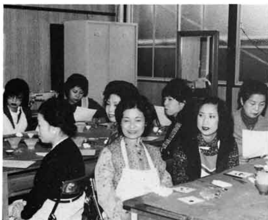
1981. 毎年L.レディの会実施 種々と勉強会も