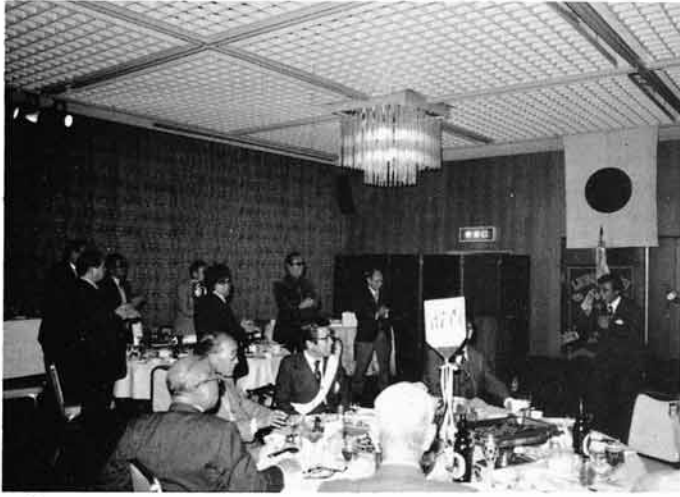
↑ 毎年正月の第1例会後は紅・白に分けてカラオケ同好会(全員参加) コミュニケーションの場をつくる(1981.1. 於仙台ホテル)