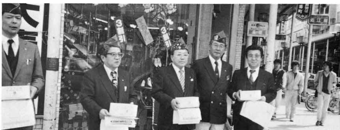
ひかりの箱募金活動（一番町に於て）