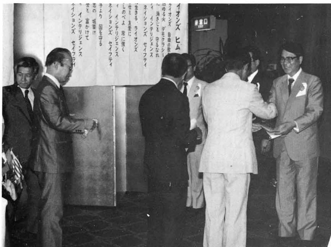
姉妹クラブ 東京新宿東クラブと毎年お互いに表敬訪問実施(1982. 於東京椿山荘)