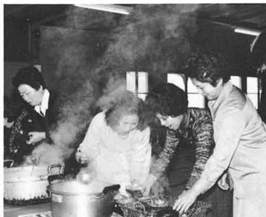
1981. 毎たのしい家族会 時にはイモ煮会も