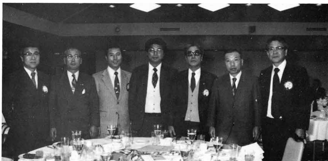
7つの子クラブめいめいと合同例会の実施 1983. 岩沼クラブと（於仙台ホテル）