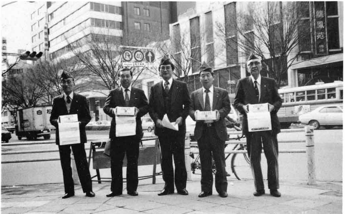
ひかりの募金活動(一番町に於て)